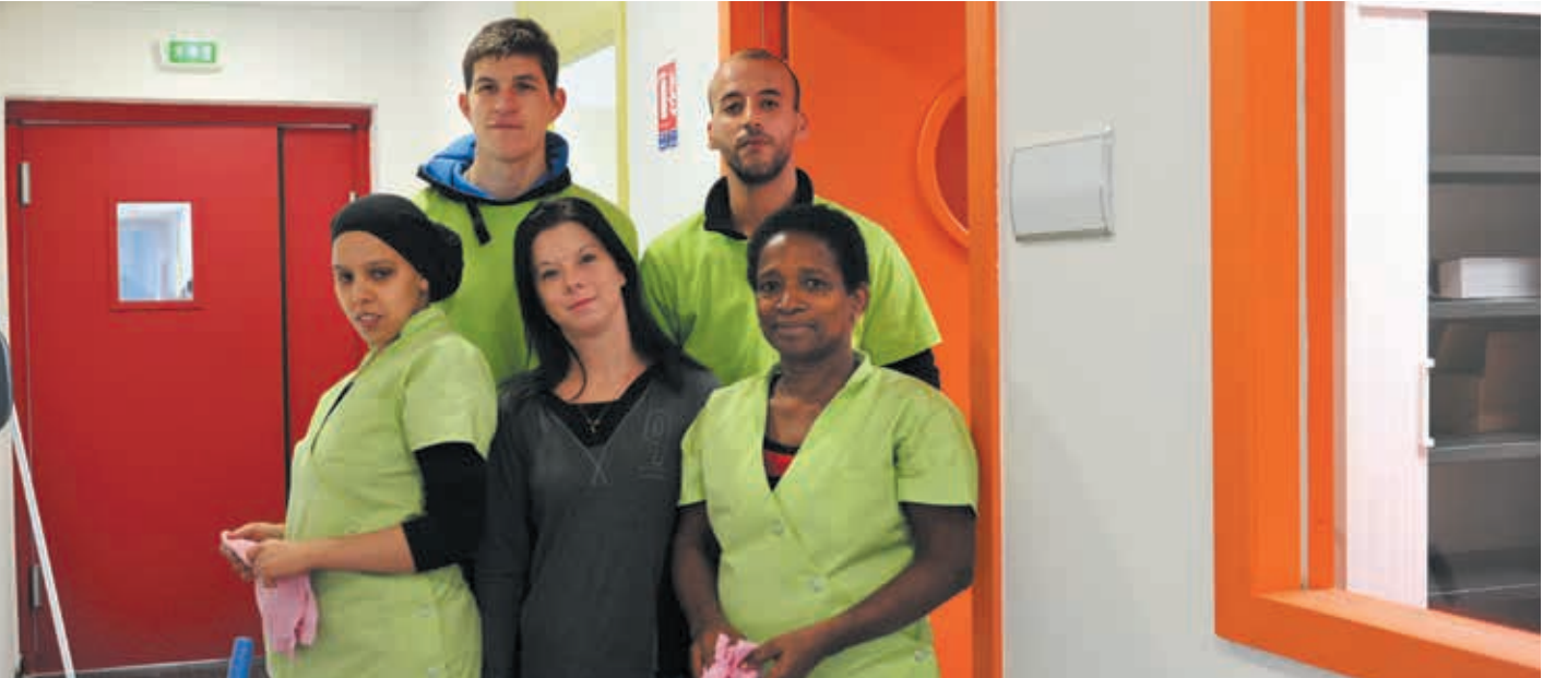
Après un an d'activité, l'entreprise Cleaning Bio 34, qui mise sur le bien-être de ses employés, compte déjà 26 salariés.